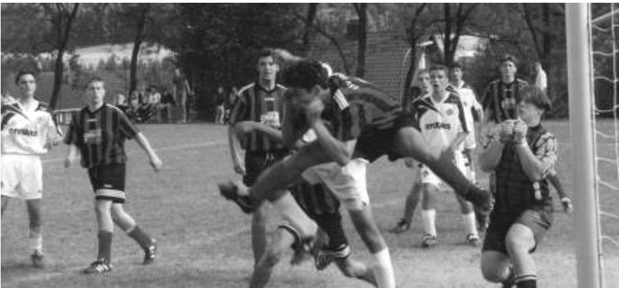
Spannende Spiele erwarten die Zuschauer