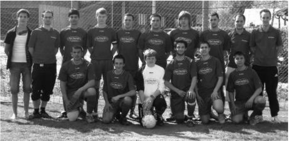
Die A-Junioren-Mannschaft des TSV Sulzbach/Laufen