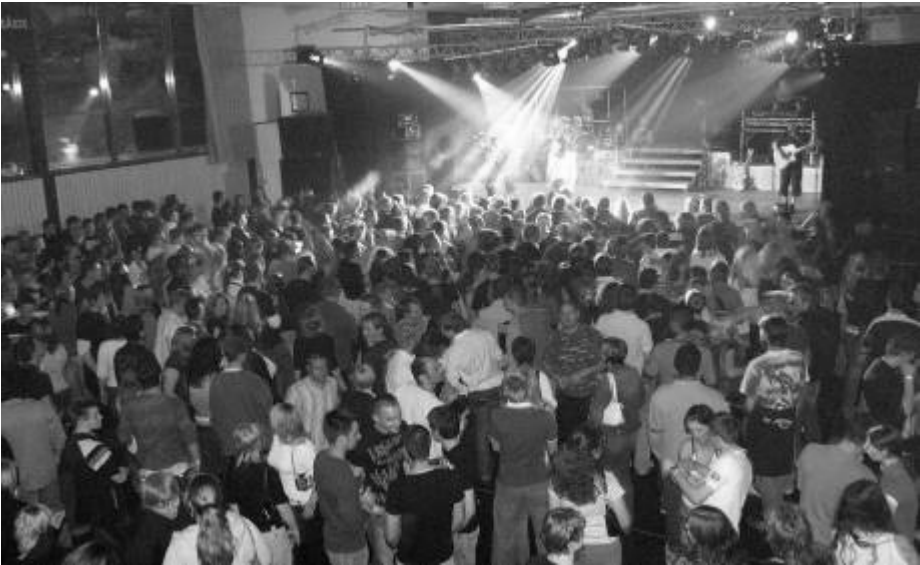
Für ein volles Haus und viele begeisterte Jugendliche sorgte die Gruppe „ONE“ im Jahre 2006