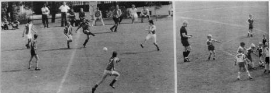
Der Fichtenberger Sportplatz wurde zur Hochburg des Jugendfußballs

Wanderpokale gingen nach Mainhardt und Steinach