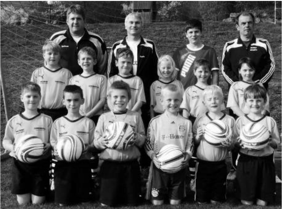
F-Junioren mit Trainerteam April 2010

Wichtig für den Teamgeist sind besonders auch die außersportlichen Tätigkeiten, wie zum Beispiel eine Fahrradtour, freiwilliges Training im Minispielfeld und der Saisonabschluss mit den Eltern als Eventwochenende.