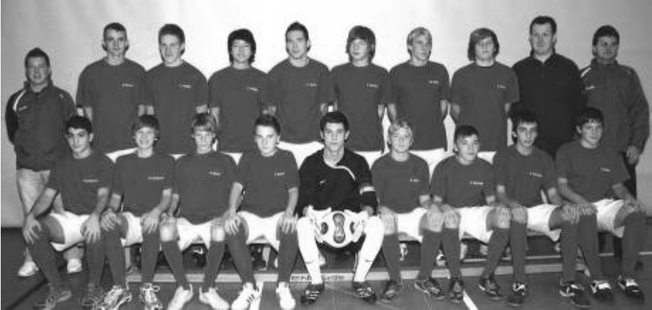
Die B-Junioren des TSV Gaildorf

Mit dem offiziellen Festabend werden am Freitag die Turniertage eröffnet. Am Samstag und Sonntag werden Gruppenspiele ausgetragen.