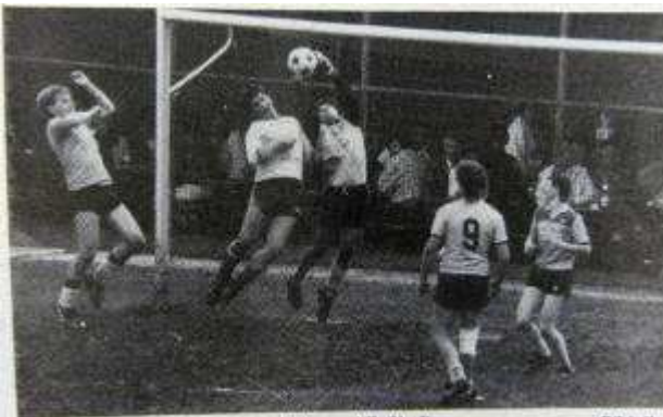
Spannende Spiele zeigten die A-Jugend-Fußballer.