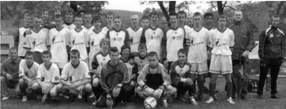
Die B-Jugend aus Proszowice und der SKF