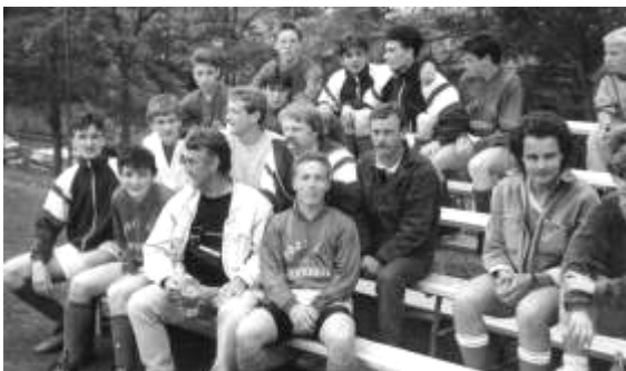
Die A-Jugendmannschaft aus Bruyere/Frankreich

Damit ging der Wanderpokal der Gemeinde Fichtenberg erstmals ins Ausland.